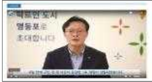
▲ 공감청원 구청장 답변