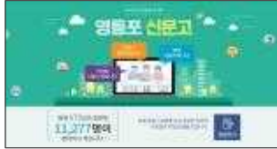
▲ 전용 홈페이지