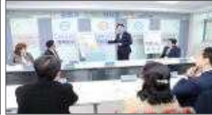
▲ 공감청원 주민대화