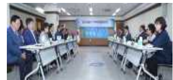
< 지역치안협의회 개최 >