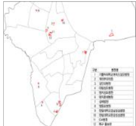
< 특구 위치도 >