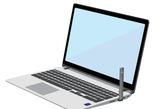
컴퓨터를 활용해 충전가능 (이럴 경우 마치 USB를 사용하는 것처럼 보일 수 있음)