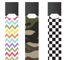
줄을 취향에 맞게 꾸밀 수 있는 스티커