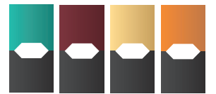
팟(액상카트리지) 맛에 따라 색상이 다름