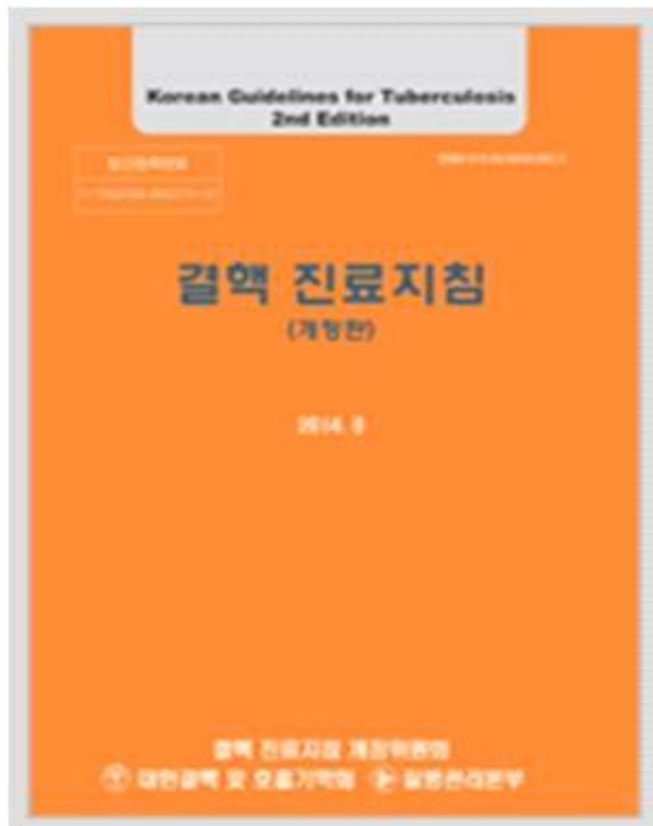
< 결핵 진료지침 (PDF) (전문가용) >

※ 다운로드 위치 : http://tbzero.cdc.go.kr -> 결핵자료