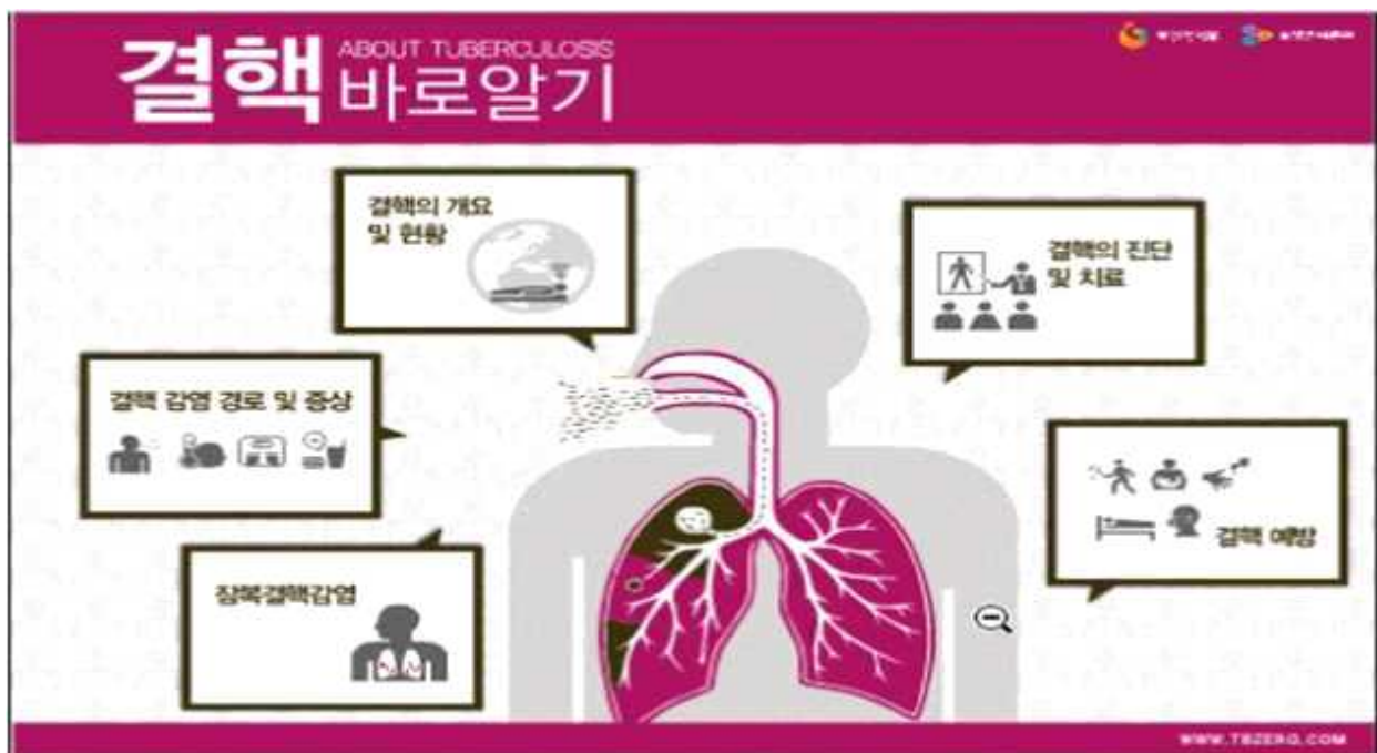
< 결핵 바로알기 (Prezi, PDF) (일반인용) >