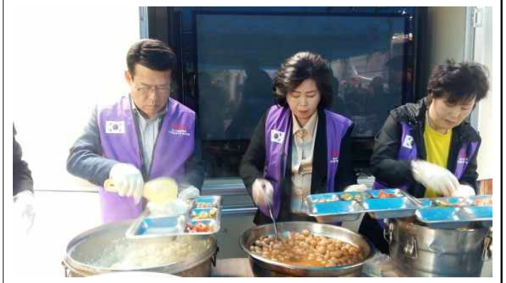
광야교회 노숙인 배식 봉사