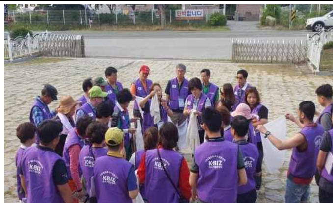
천연염색 감물드리기 실습