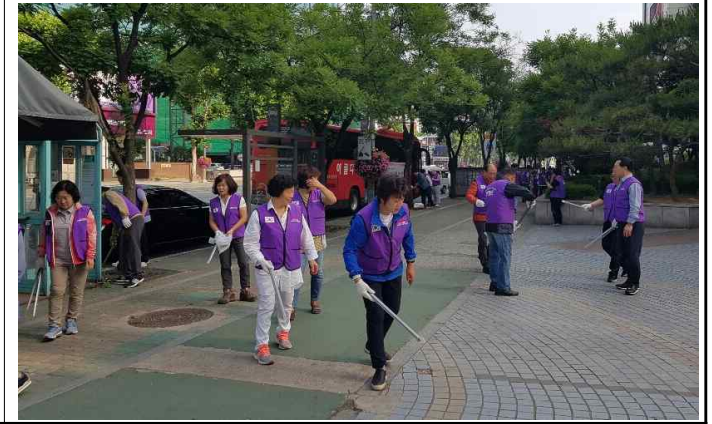
환경정리 및 쓰레기 수거